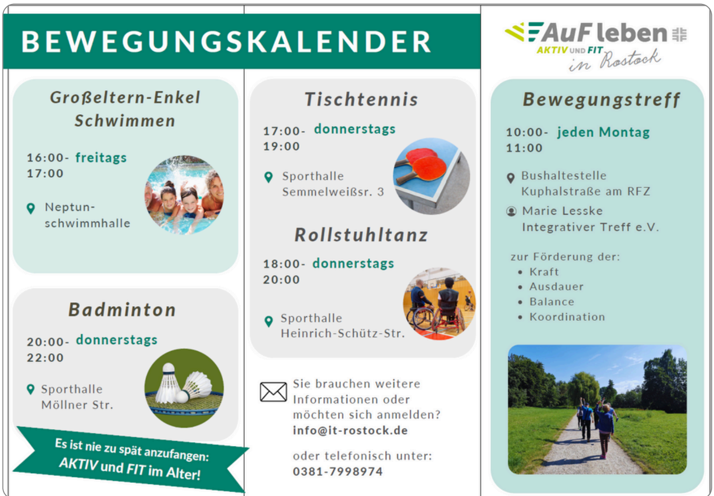
Abb.7: Bewegungskalender IT Rostock